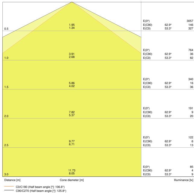
LDC typ cone