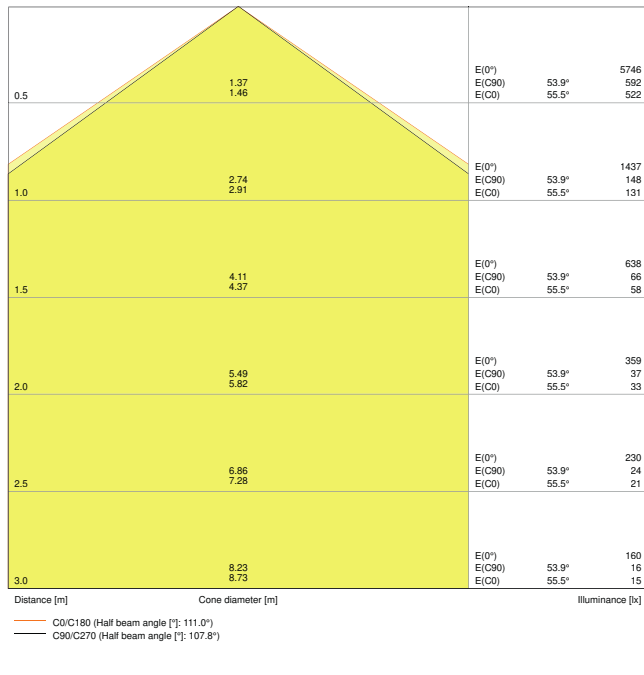
LDC typ cone