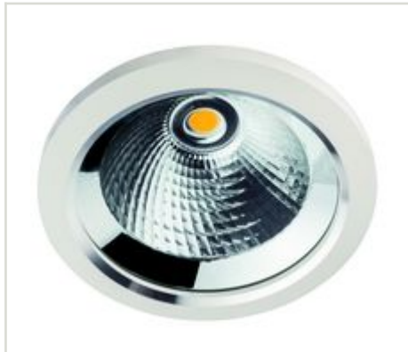
sandweiss, 4000K CALA - 14W IP43 36° 350mA Artikel-Nr.: 46141

für die Innenanwendung, IP43 · · Gehäuse: Aluminium-Druckguss (Schutzglas, klar) · Gehäusefarbe: sandweiß · nicht schwenkbar · Ausstrahlwinkel: 36° · Leistung: 14 W · Lichtfarbe: 4000 K · Lichtstrom: 1464 lm · CRI: >80 · Lebensdauer L70B50: >= 50.000 h · Betriebsstrom: 350 mA DC · Schutzklasse III · Einbautiefe: 110 mm · Deckenausschnitt: 105 mm · Außendurchmesser: 116 mm · Energieeffizienzklasse: E · exklusive Konstantstrom-Konverter